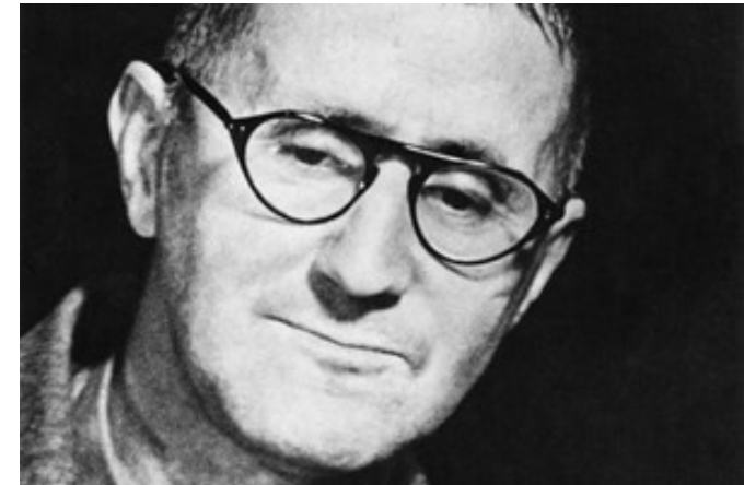
Eugen Berthold „Bert“ Friedrich Brecht * 10. Februar 1898 † 14. August 1956 deutscher Dramatiker und Lyriker im 20. Jhdt.

Bertold Brecht um 1929, Refrain des Solidaritätsliedes