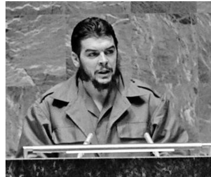
Ernesto Rafael „Che“ Guevara de la Serna, * offiziell 14. Juni 1928, ev. 14. Mai 1928 † 9. Oktober 1967 marxistischer Revolutionär, Guerillaführer, Arzt und Autor

„Solidarität ist die Zärtlichkeit der Völker.“ Che Guevara