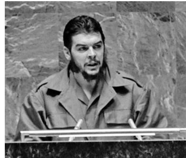
Ernesto Rafael „Che“ Guevara de la Serna, * offiziell 14. Juni 1928, ev. 14. Mai 1928 † 9. Oktober 1967 marxistischer Revolutionär, Guerillaführer, Arzt und Autor

„Solidarität ist die Zärtlichkeit der Völker.“ Che Guevara