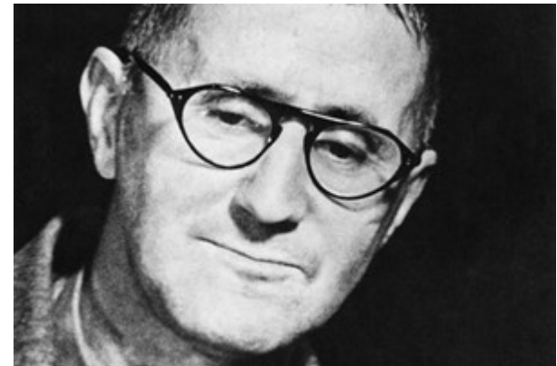
Eugen Berthold „Bert“ Friedrich Brecht * 10. Februar 1898 † 14. August 1956 deutscher Dramatiker und Lyriker im 20. Jhdt.

Bertold Brecht um 1929, Refrain des Solidaritätsliedes