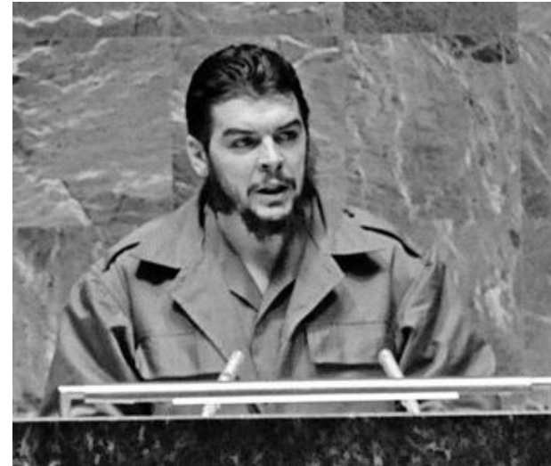
Ernesto Rafael „Che“ Guevara de la Serna, * offiziell 14. Juni 1928, ev. 14. Mai 1928 † 9. Oktober 1967 marxistischer Revolutionär, Guerillaführer, Arzt und Autor

„Solidarität ist die Zärtlichkeit der Völker.“ Che Guevara