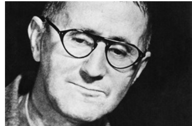
Eugen Berthold „Bert“ Friedrich Brecht * 10. Februar 1898 † 14. August 1956 deutscher Dramatiker und Lyriker im 20. Jhdt.

Bertold Brecht um 1929, Refrain des Solidaritätsliedes